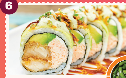
KOMODO CROCANTE ROLL Edamames