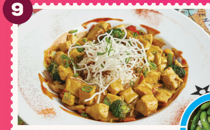
CHICKEN CURRY NACION Edamames