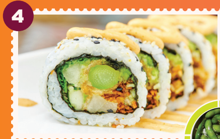
FUJI DELI ROLL Edamames