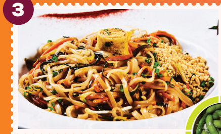
VEGETARIAN PHAD THAI Edamames