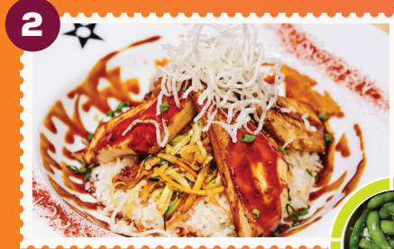
CHICKEN TERIYAKI Edamames