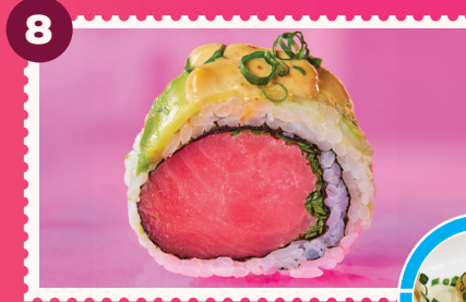
SPICY TUNA ROLL 3 Gyosas