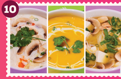
SOPA DEL DÍA 3 Gyosas