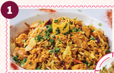
CHICKEN NASI GORENG 3 Gyosas

11:30am - 3:30pm | lunes a viernes | solo dine-in. No válido en días feriados.