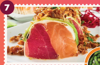
KYOTO ROLL (KETO) Edamames