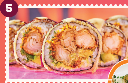
SOY NACION ROLL 3 Gyosas